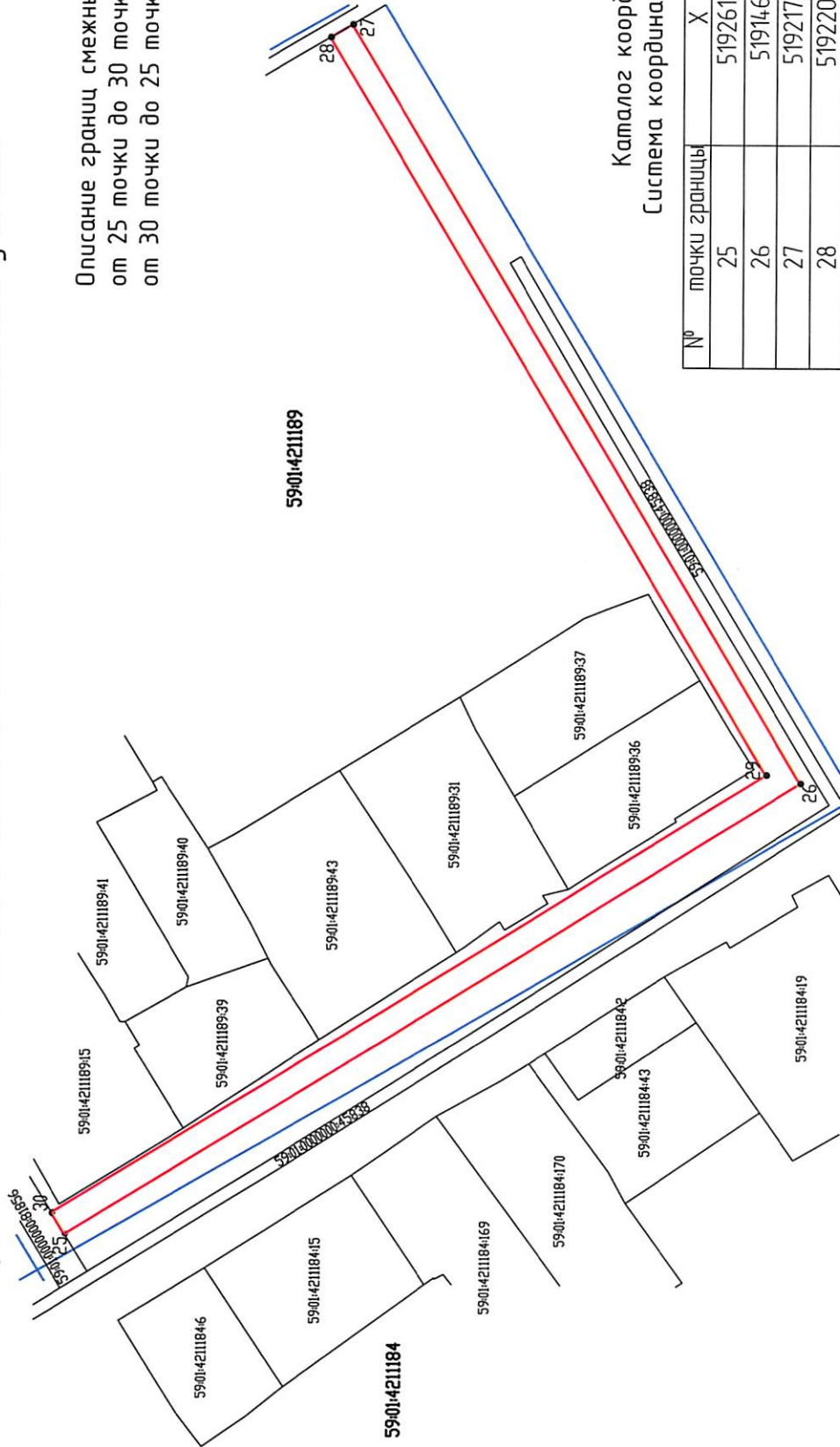
Каталог координат Система координат МСК-59

Описание границ смежных землепользователей: от 25 точки до 30 точки - муниципальные земли от 30 точки до 25 точки - муниципальные земли